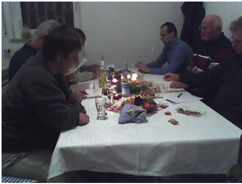
Vorstandssitzung in der Damen-Umkleidekabine!

Zur letzten Sitzung im Jahr 2010 traf sich der TCH Vorstand in der, als Aufenthaltsraum dienenden Damen-Umkleidekabine. Nach dem Verlust unseres Clubhauses im Frühjahr durch Brandstiftung musste vieles improvisiert werden, so jetzt auch unser Übergangsdomicil für den Winter.